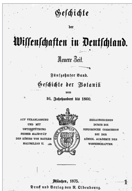
1 Titulní strana německého vydání Geschichte der Botanik z r. 1875

V roli „kladných hrdinů“, autorů, jejichž teoretických konceptů si Sachs naopak cení, se pak ocitají především experimentální botanikové jako Marcello Malpighi,