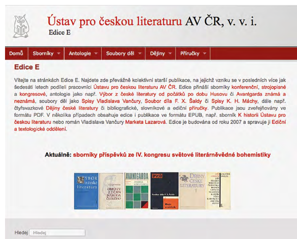
Literárněvědné edice dostupné na stránkách ÚČL AV ČR.