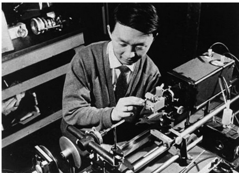
Obr. 1. Charles Kuen Kao při práci v optické laboratoři v 60. letech 20. století.

Kao a Hockham začali podrobně analyzovat možnosti optických vláken. Hockham prováděl výpočty tolerancí na fluktuace rozměrů jádra vlákna a své výpočty ověřil na modelovém vlnovodu z oblasti mikrovln. Kao se soustředil na otázku transparentnosti dostupných optických materiálů. Hledal ve vědecké literatuře, oslovoval experty, ale