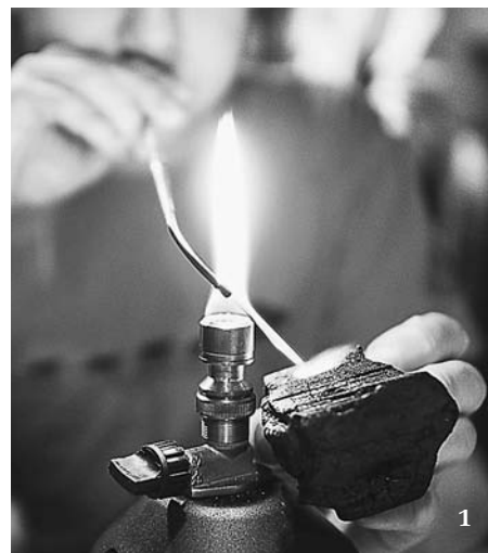
1 Účastníci Biologického soustředění Arachne si letos prakticky vyzkoušeli také historické forenzní metody (redukce stříbra na dřevěném uhlí pomocí dmuchavky).

hlásili ať už na hlavní letní soustředění, či na jednu z kratších akcí probíhajících na podzim a na jaře, najdou bližší informace na internetové stránce www.arach.cz .