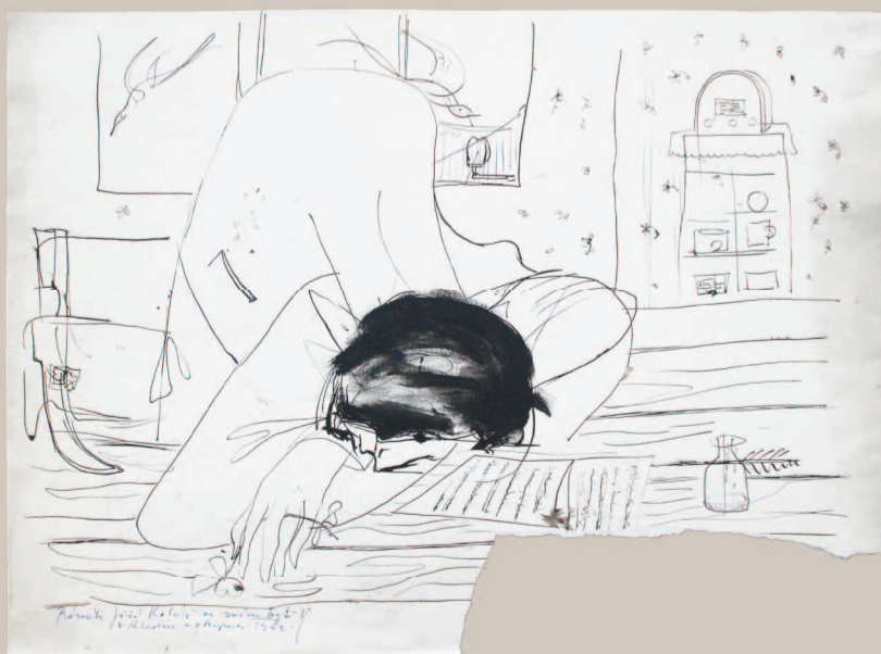
Karel Souček, karikatura Jiřího Koláře (první polovina 40. let)