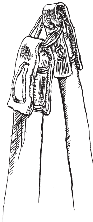
Cep – detail. Dolní Rozmyšl (Sokolovsko), 60. léta 20. stol.