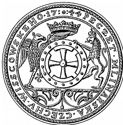
Pečet mlynářského cechu. Vyškov, 1744