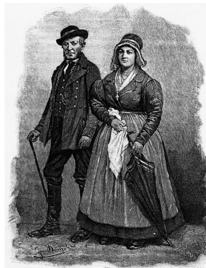
Sedlák a selka z okolí Jeseníku. 19. stol.

v mužském kroji z reprezentačních a prestižních důvodů. Zůstával dlouhý kožich východomoravského střihu a vysoká kožešinová čepice se stužkami. Dívky si zde už nezaplétaly vlasy k jehlici a vdané ženy nosily v létě měkký plátěný čepce, v zimě se bílý vyšívaný nebo potištěný šátek spínal nebo vázal pod bradou. K zimnímu oblečení patřil i kabátek podšitý kožešinou nebo kožíšek s výraznými šůsky. Na svatbě a k dalším obřadním příležitostem se přehazoval černý pelerínový plášť s velkým límcem. Plátěné přehozy, složené ze dvou kusů plátna a spojené červeně vytkávanou nebo vyšívanou vložkou, přecházely postupem doby do obřadního oblečení. – U německého etnika v j. Čechách a na j. Moravě byla jiná situace než v severních územích. Oblečení na Šumavě se vyznačovalo delším používáním domácích surovin: hrubého lněného plátna a šerky. Proto se mužské kalhoty šily nejen z kůže, ale i z těchto materiálů. Zhotovovalo se z nich i svrchní oblečení. Kolem poloviny 19. stol. se letní vesty na svátek šily z červeného hedvábí. Od 60. let 19. stol. se na Šumavu rozšířily z Bavor ozdobné opasky vpředu s elipsovitou ozdobou, vyšívané pavím brkem, od 40. let 19. stol. se vyskytovaly kabáty ( kaputy ) a v zimě pláště s velkým límcem, oblékané i přes kaput. Pod široké klobouky se braly čepičky, většinou pletené. Kolem r. 1840 nosili zástěry zejm. ti, kteří pracovali u koní (mimo práci byly svinuté