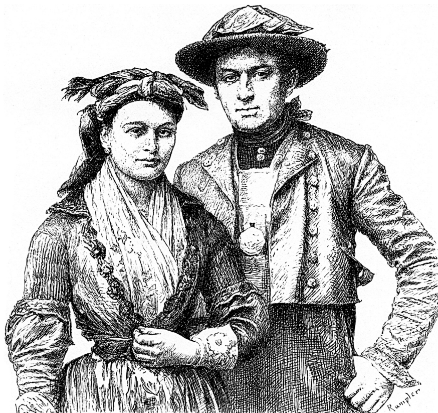
Typy lidového oděvu z Chebska. 19. stol.

ostrovech. Kroj německých obyvatel netvořil jeden celek, ale vázal se vždy k určitému kraji. Proto lze vysledovat vztah jak k oblečení v českém vnitrozemí, tak k přílehlým zahraničním sousedům rakouským, bavorským, hornofalckým, saským a slezským. V 19. stol. podléhal kroj Němců stejným vývojovým trendům jako kroj českého etnika: odkláněl se od stavovského oblečení a vytvářel jednotný občanský oděv (dříve na území s rozvíjejícím se textilním průmyslem). – Mužský kroj se na počátku 19. stol. vyznačoval méně individuálními rysy než kroj ženský a pro velké území platil stereotyp: žluté nebo černé koženky po kolena, šle, soukenná červená vesta, hnědý nebo tmavý kabátek, šosatý kabát různé barvy, bílé nebo modré punčochy, střevíce s přezkou, vysoké boty, klobouk zprvu třírohý, pak kulatý, kožešinová čepice. Postupem doby se kalhoty prodlužovaly, svrchní oblečení se šilo z továrních látek a přejímal se městský střih. Na hlavě se nosily cylindrové klobouky. Nejdéle se v oděvu udržely všední praktické součásti v místě osvědčené. Mužský kroj zanikal už od 2. třetiny 19. stol. – Ženský oděv se vyznačoval větší různorodostí a delší životností. Na Chotěšovsku, Kladrubsku a na Horšovskotýnsku souvisel s českým a lišil se jen v detailech. Archaičtější ráz měl kroj na Chebsku. Uchoval si temné ladění barev