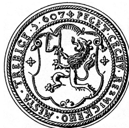
Pečeť řeznického cechu. Třebíč, 1607