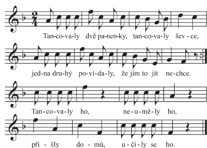
Řemeslnický tanec švec (ševcovská). Přím u Rychnova n. Kněžnou, Vycpálek 1921, s. 183

řemeslnické písně a) souborné označení písní zpívaných k tancům napodobujícím řemesla. Opírají se o základní taneční rytmy 2/4 (polka) nebo 3/4 taktu (sousedská). Mají jednoduchý nápěv instrumentálního typu, pohybují se většinou v malém tónovém rozsahu a výraznými rytmy doprovázejí pohyb tanečnicků napodobujících jednotlivé pracovní úkony či pohyby řemeslníků při práci (tahání dratve na ševcovském verpánku, pohyb člunku u tkalcovských stavů, kutí kovářů, rozdmýchávání kovářské výhně). Patří k novější písňové vrstvě, většinou vznikaly od poloviny 19. stol.; b) označení písní s tematikou