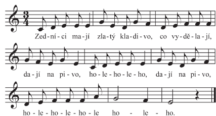
Zednická řemeslnická píseň. Postřekov (Chodsko), zapsala V. Thořová 1991

řemesel. Vážně či žertovně oslavují příslušný cech, vyzdvihují přednosti určitých řemesel, jiná naopak haní. Tyto písně jsou většinou tradiční, vyskytují se však mezi nimi i některé novější, pololidového, resp. městského původu ( Stavěli tesaři, stavěli lešení ). Nejčastěji bývají zastoupena řemesla: