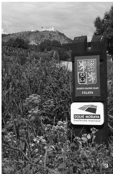
3 Zvláště chráněná území jsou součástí každé biosférické rezervace. Územní překryv však neznamená významovou shodu.

V r. 1983 UNESCO svolalo 1. mezinárodní kongres o biosférických rezervacích v Minsku v Bělorusku, kde vznikl Akční plán pro BR, které začaly být chápány ve své původně zamýšlené podobě, a to jako