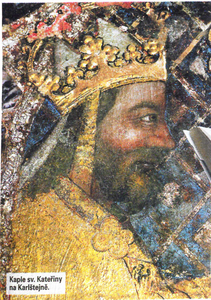
Kaple sv. Kateřiny na Karlštejně.