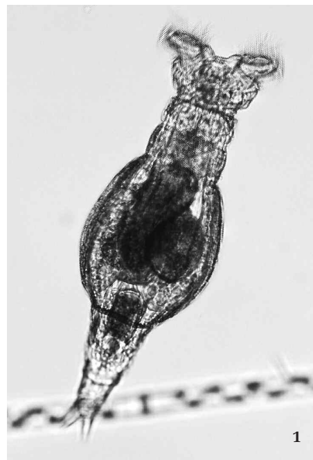
1 Pijavenka rodu kolovratka ( Philodina , třída Bdelloidea ) při získávání potravy.

U některých živočichů s oběma pohlavními se mohou v určitém období vyvíjet i neoplozená vajíčka, jež mají novou DNA. Existují však živočichové, kteří sexualitu zcela opustili, aniž by jim to jakkoli vadilo. Jde asi o 300 druhů vírníků třídy pijavenky ( Bdelloidea ), miniaturních tvorů velkých