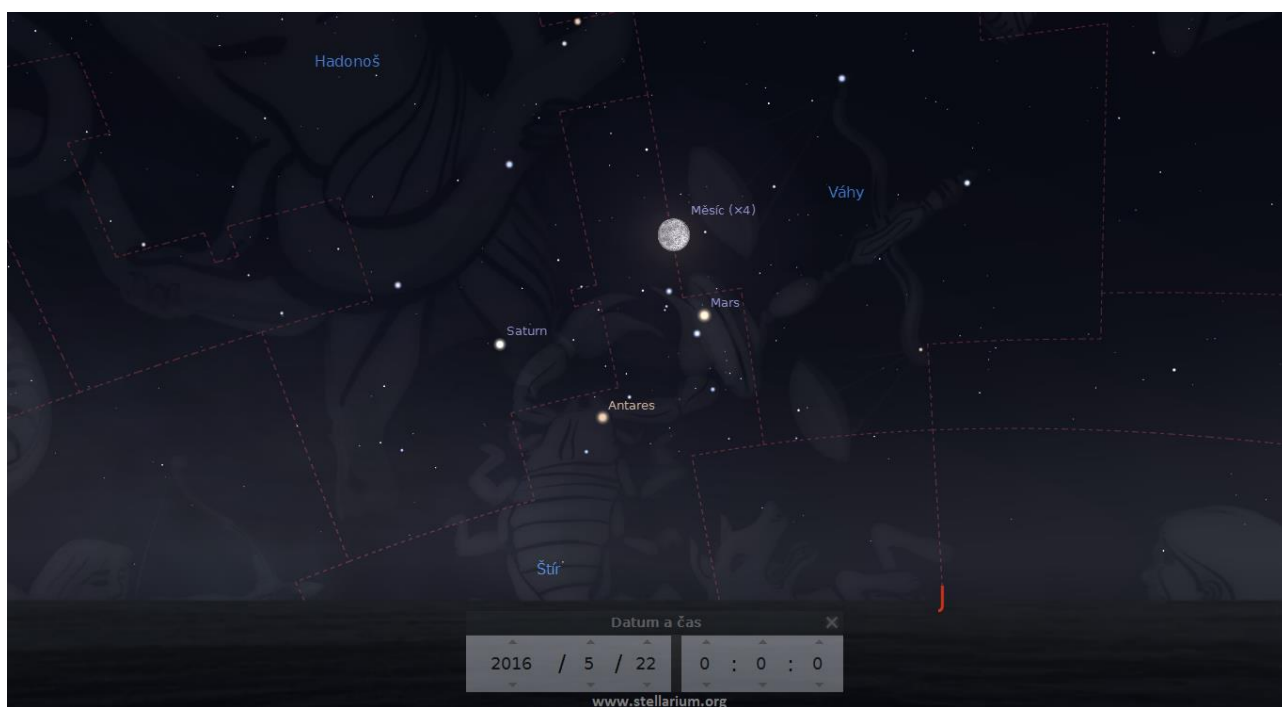
Mars v opozici v seskupení se Saturnem, Antaresem a Měsícem