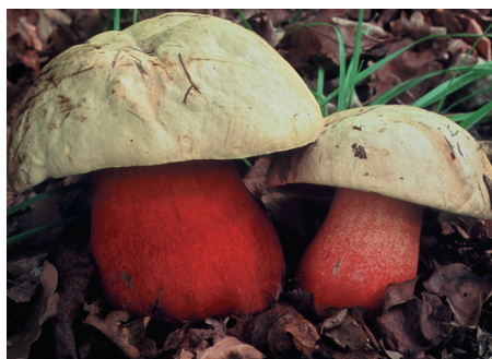
Hřib nachový (Boletus rhodoxanthus), nový vzácný druh na lokalitě Velký vrch u Vršovic na Lounsku. Foto J. Zavřel (2002)

Jelikož hřiby ze skupiny satanů studují již dlouhou dobu i na Džbáně v lounském