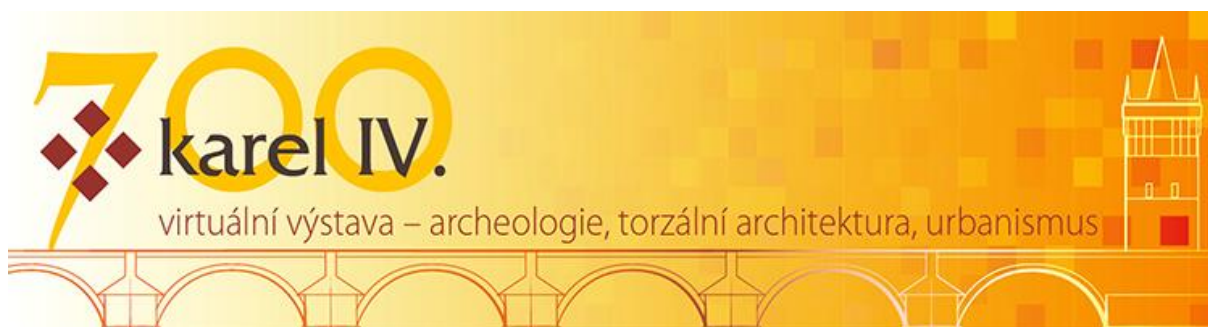
Obr. 5. Banner k výstavě, věnované 700. výročí narození císaře Karla IV.