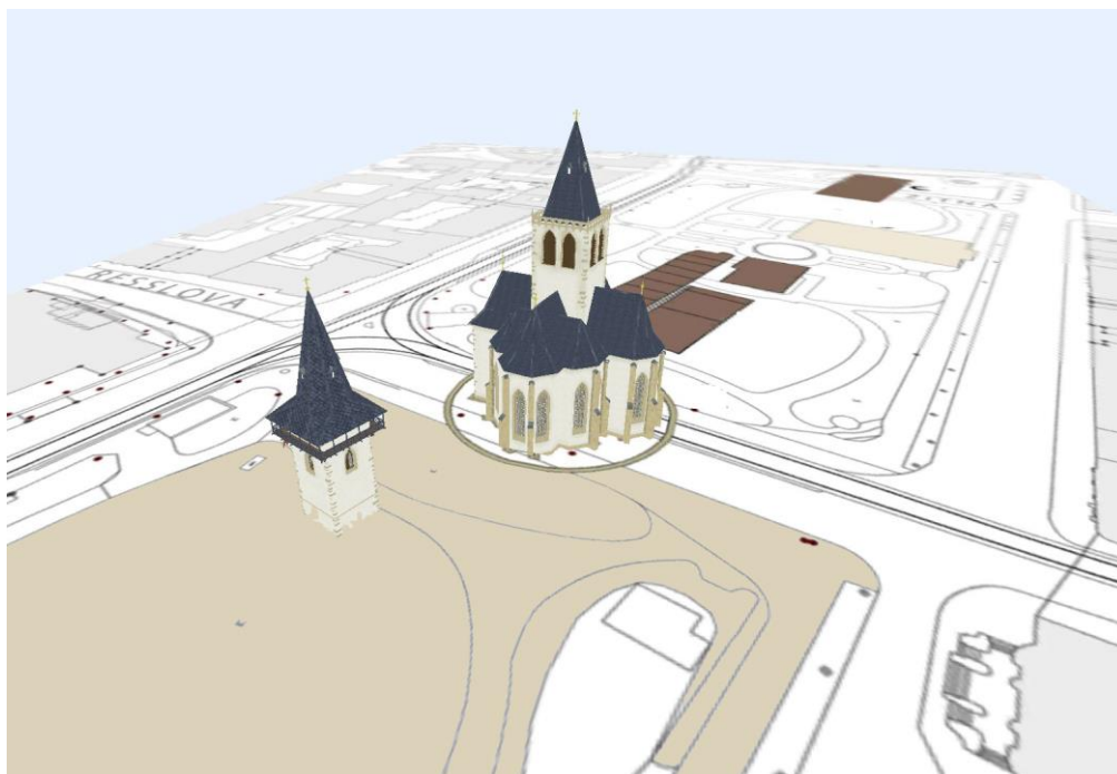
Obr. 1. Kaple Božího Těla na Karlově náměstí.