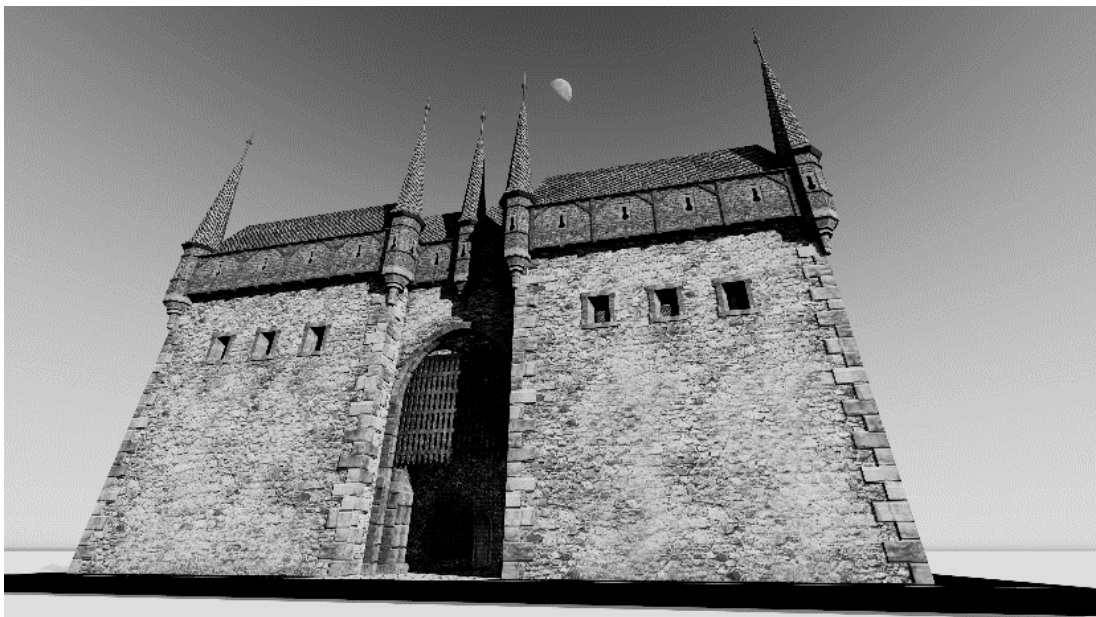
Obr. 3. Brána Špička na Vyšehradě.