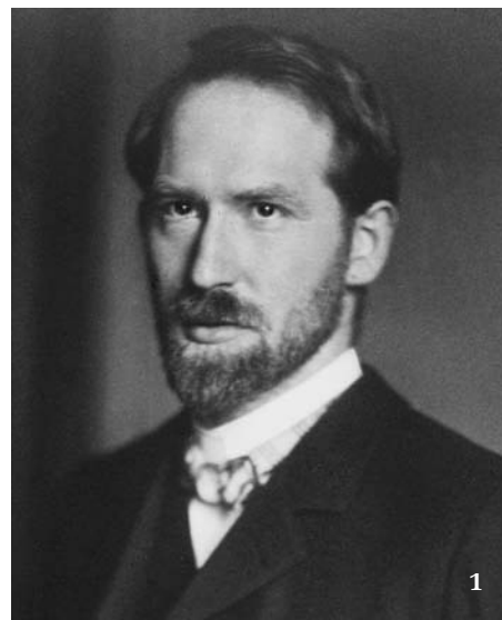
1 Švýcarský botanik Albert Thellung (1881–1928).

původní flóře francouzského města Montpellier, později rozpracoval v článku vydaném v letech 1918–19. Šlo o práci nesmírně důkladnou a systematickou, obsahující přesné definice termínů ve francouzštině, angličtině a němčině. Stejně jako dnes používané systémy založil klasifikaci na způsobu zavlečení, době introdukce a úspěšnosti druhu v novém území. K vytvoření pojmosloví používal řečtinu. Na Thellungovu fytogeografickou klasifikaci navázala řada následovníků, ti však už vesměs nepřinášeli mnoho nového, spíše jeho terminologii zjednodušovali. Dlužno sice připomenout, že úplně první pokus představuje dílo Alphonse P. de Candolla z r. 1855 a sám Thellung vycházel z práce švýcarského předchůdce Martina Rikliho, který se o vytvoření klasifikačního systému pokusil v r. 1903. Thellungův koncept byl však průkopnický tým, že kladl důraz na populační přístup a jasně definoval environmentální bariéry, které zavlečené druhy musejí překonávat.