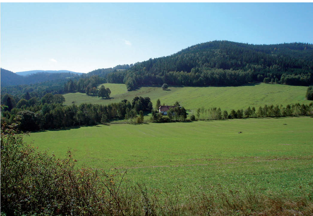
Krajina Novohradských hor je atraktivní pro amenitní migranty.

Amenitní migraci ovlivňují podle Koppa a kol. (2009) tři skupiny faktorů. První skupina faktorů se týká cílového místa migrace a souvisí se sociálně-ekonomickými charakteristikami migrantů, respektive s jejich domácností (příjmy, typ bydlení, velikost domácnosti apod.). Druhou kategorií jsou přírodní faktory cílové oblasti, jako např. vlastní přírodní potenciál krajiny, reliéf, krajinný ráz, ochrana přírody, kvalita životního prostředí, charakteristika sídel, míra perifernosti apod. Třetí kategorií tvoří celková ekonomická úroveň státu, nástroje ovlivňující trh s nemovitostmi nebo rozvoj venkova, nástroje ochrany krajiny, právní řád apod. Tyto tři skupiny faktorů mají objektivní povahu, jsou snadno měřitelné či hmatatelné. Podle našeho názoru by bylo k těmto třem skupinám faktorů ovlivňujících amenitní migraci vhodné připojit také skupinu faktorů subjektivní povahy, kam by se dala zařadit rozdílná regionální identita či image regionu. Jako příklad lze uvést