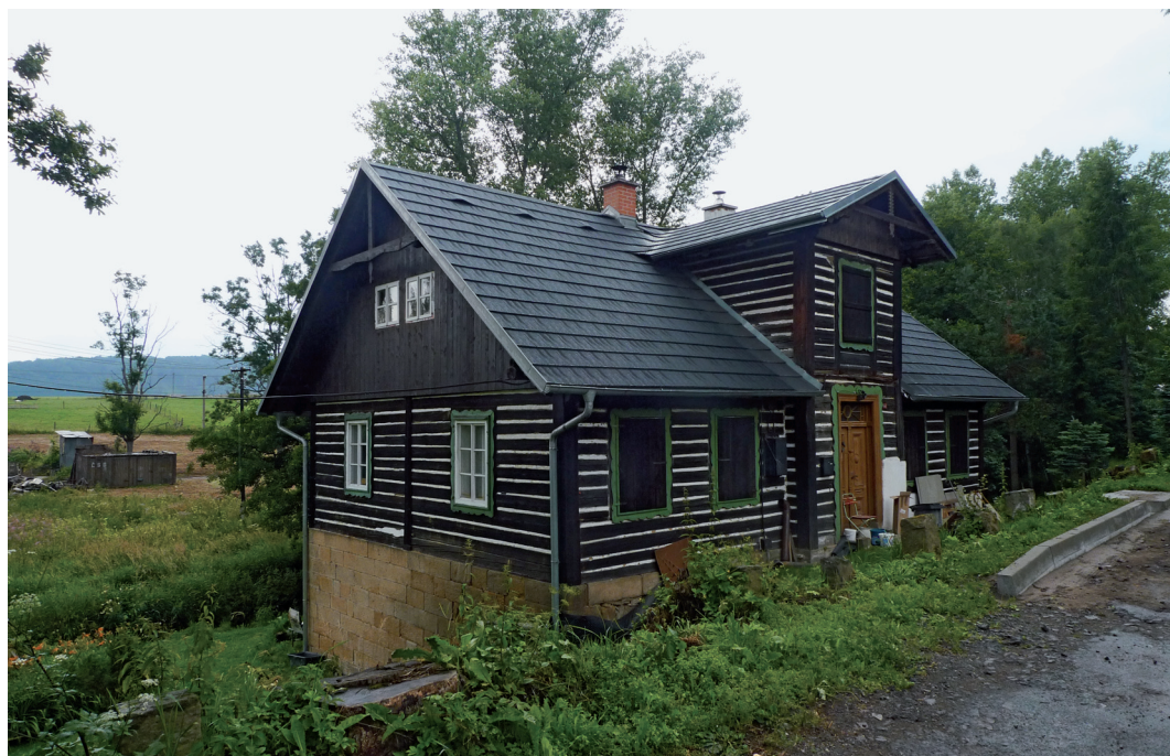
Amenitní migranti preferují tradiční venkovská obydlí v blízkosti přírody.

Hodnocení vlivu amenitní migrace na utváření regionální identity ukázalo, že existují značné rozdíly mezi stálými obyvateli a amenitními migranty. Amenitní migranti například pozitivněji hodnotí životní prostředí, zvyky a tradice regionu včetně jeho historie a architektury. Ve svých hodnoceních používají často pozitivní citová zabarvení popisující okouzlenost okolním prostředím. Na druhou stranu negativnější hodnocení než stálí obyvatelé měli amenitní migranti u ekonomické situace regionu, možností kulturního využití a u dopravní