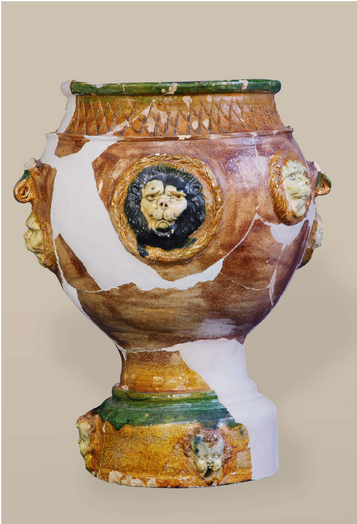
VALDŠTEJNŮV JIČÍN A FRÝDLANTSKÉ VÉVODSTVÍ