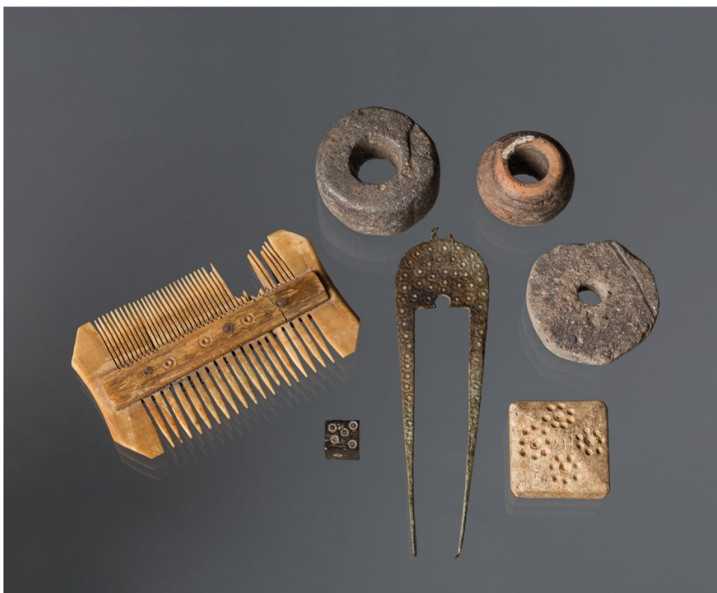
Obr. 4. Kostěný hřeben a hrací kostky, raménko vážek a keramické přesleny ze 13.–14. století. Z výzkumu Týnského dvora na Starém Městě.