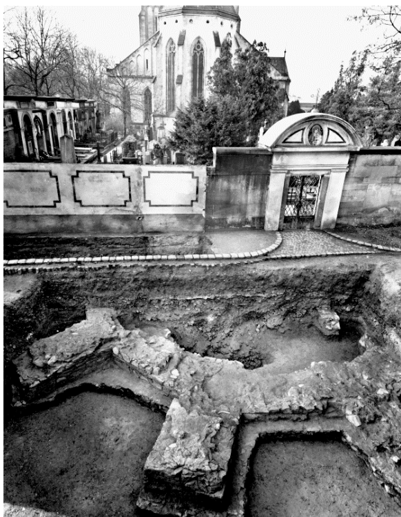
Obr. 5. Gotický chór baziliky sv. Petra a Pavla na Vyšehradě odkrytý archeologickým výzkumem v roce 1968.