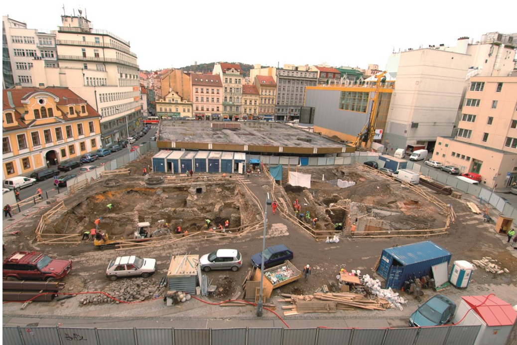
Obr. 3. Výstavbě nového obchodního centra Quadrio ve Spálené ulici na Novém Městě předcházela rozsáhlý záchranný archeologický výzkum (stav 2009).