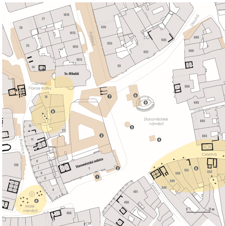
Obr. 7. Staroměstské náměstí s vyznačením nejvýznamnějších archeologických nálezů a zaniklých staveb. Černě vyznačena dochovaná patra románských kvádríkových domů, dnes převážně v úrovni suterénu.