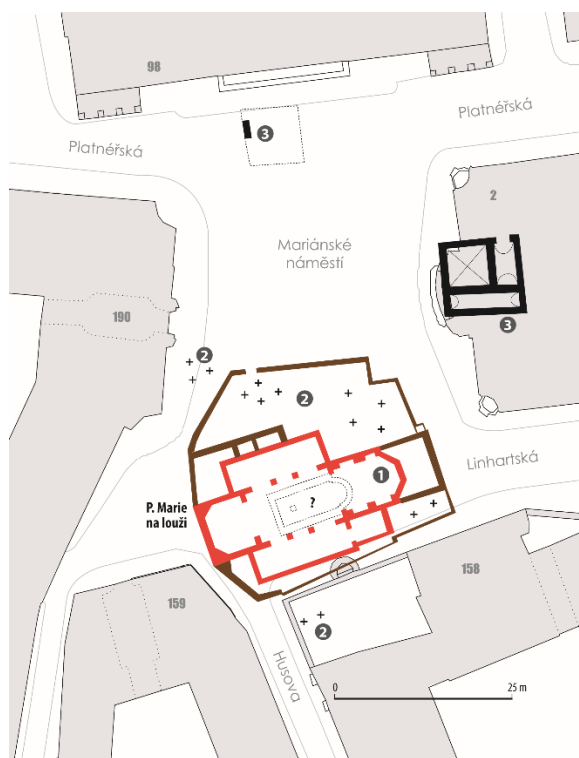
Obr. 6. Plánek Mariánského náměstí se zakreslením románské a gotické fáze výstavby kostela Panny Marie na louži a základů románských domů. Křížky vyznačují plochu hřbitova.