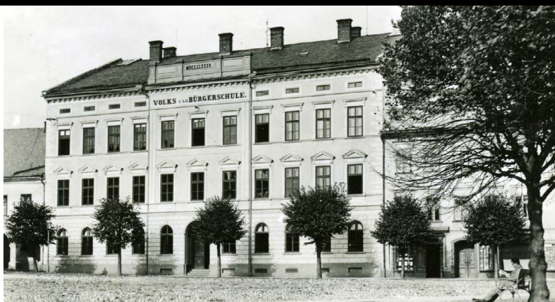
Městská škola Grulich / Králíky, projekt Ústavu soudobých dějin AV ČR, v. v. i., řešitelka: PhDr. Helena Nosková, CSc.

Současné oživení regionální spolupráce směřuje k zapojení dalších krajů a ústavů AV ČR. Témata základního výzkumu a jeho aplikací budou reagovat na sociální, ekonomické, kulturní a ekologické potřeby oblasti.