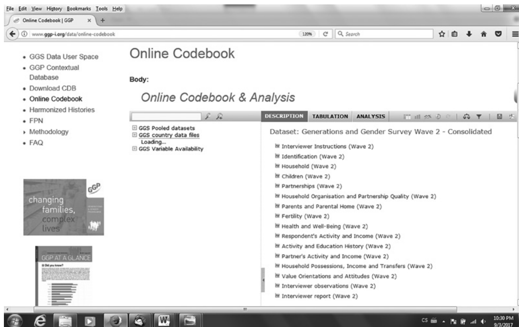
Obrázek 2: Tematické oblasti pokryté v datech GGP.