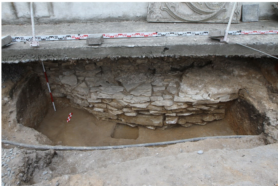
Obr. 3. Tisíc let staré zdivo vyšehradského kostela. Pohled na základy severní apsidy, které byly později porušeny stavbou Starého děkanství.