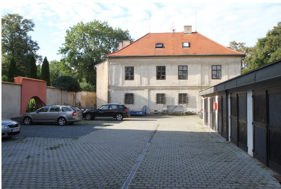
Obr. 2. Budova Starého děkanství, pod níž se nachází zhruba polovina pozůstatků zkoumaného vyšehradského kostela.