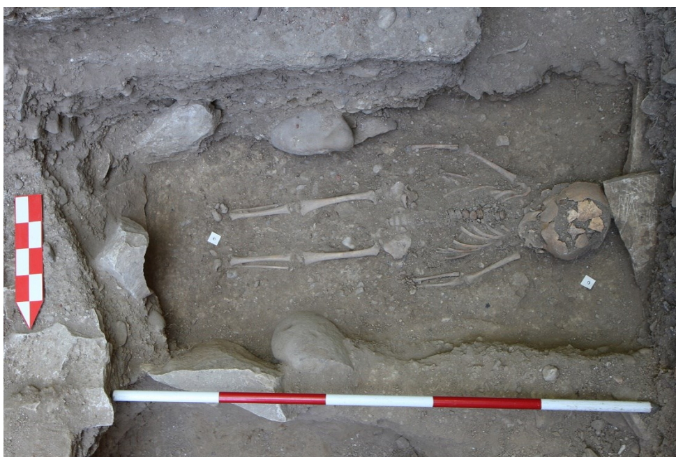
Obr. 4. Základy vyšehradského kostela byly překryty hřbitovem používaným v 11. až 14. století. Pohled na jeden z dětských hrobů.