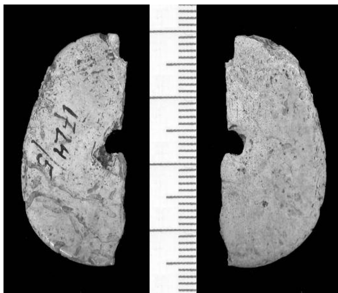
Obr. 2. Siřem, okres Louny. Polovina kotoučku ze zvířecí kosti z objektu 1.

a dva dolní řezáky dočasného chrupu a základy všech horních řezáků trvalé dentice, základy obou horních a snad levého dolního špičáku, obě horní dočasné stoličky pravé strany a první stolička levé strany, dolní první stolička levé strany, základ obou prvních horních a levé první dolní stoličky trvalé dentice. Podle dochovaných zubů i podle povahy zlomků lebečních kostí se jedná o další části dětské lebky ze sáčku napsaného Fragmente vom Schädel .