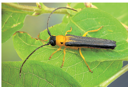
Tesařík Oberea pupillata . Dospělý brouk dorůstá 18 mm.

dřevě živné rostliny zimolezu tatarského ( Lonicera tatarica ). V době výskytu dospělců jsem prováděl odchyt buď jednotlivě, nebo sklepáváním. Výskyt tesaříka v Brně jsem zjistil v městské části Medlánky. Zimolez zde roste izolovaně, jeho křoviska tvoří podrost smíšeného lesa a rostou též hojně na jeho okraji. V převážné části okrajových keřů byly vedle čerstvých i starší požerky různého data. Je proto pravděpodobné, že zde byla O. pupillata dosud