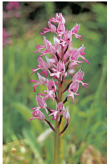
Staletí trvající pastva přispěla k velké bohatosti sekundárních nelesních společenstev, významným výskytem řady obrozených druhů, jako je např. vstavač vojenský ( Orchis militaris )

Původně královské hrady se postupně většinou dostávaly do držení vznikající šlechty. Vlivem klesající hodnoty peněz a relativně nízké efektivnosti feudálního hospodářského systému majitelé jednotlivých panství postupně hledali nové zdroje příjmů a začínali hospodařit ve vlastní režii. Zakládali panské dvory a na pozemcích k nim náležejícím pěstovali obilí a chovali dobytek. Pro lepší využití málo osídlených