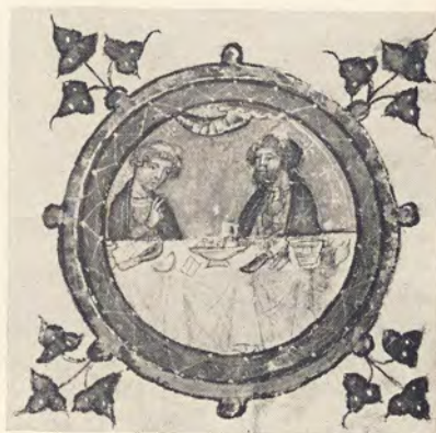
62. Alegorické zobrazení šesti měsíců v breviáři velmistra Lva (rukopis z roku 1356 – Národní a universitní knihovna, Praha)