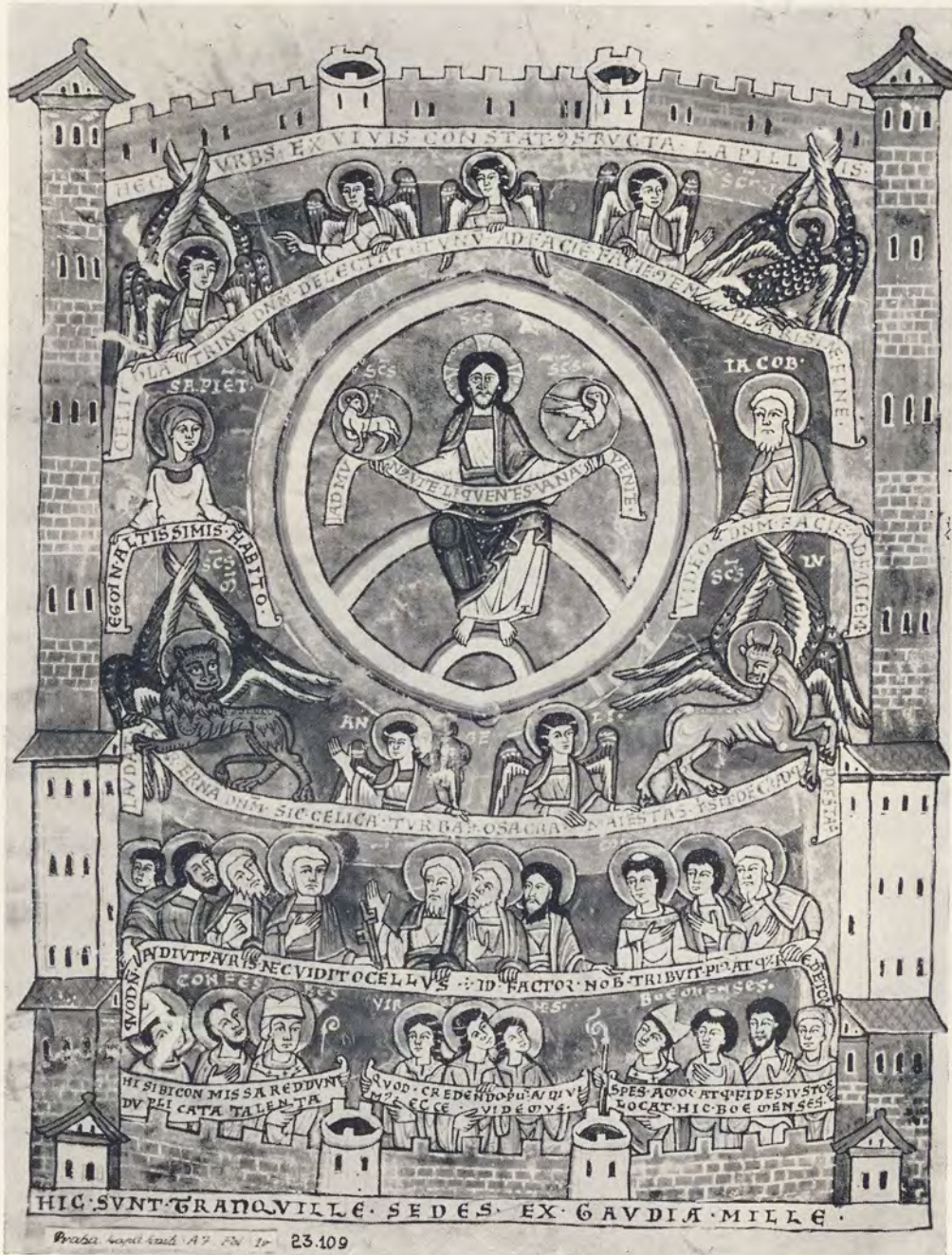
8. Kristus v majestátu z rukopisu Augustinova spisu De civitate Dei (kolem poloviny 12. stol. — Kapitální knihovna, Praha)