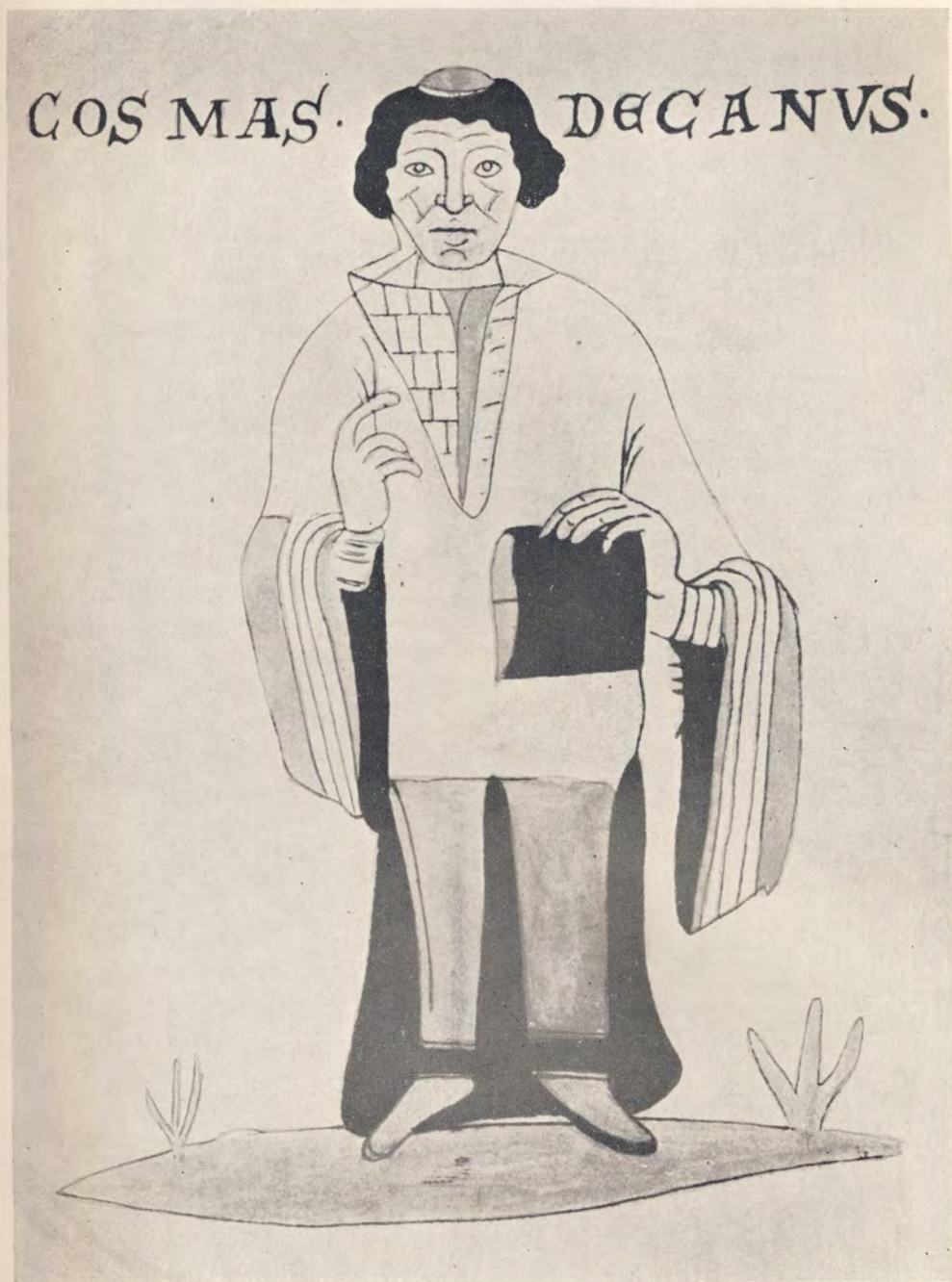
5. Kosmas podle kresby v Lipském rukopisu Kroniky české (13. stol. — Universitní knihovna, Lipsko)