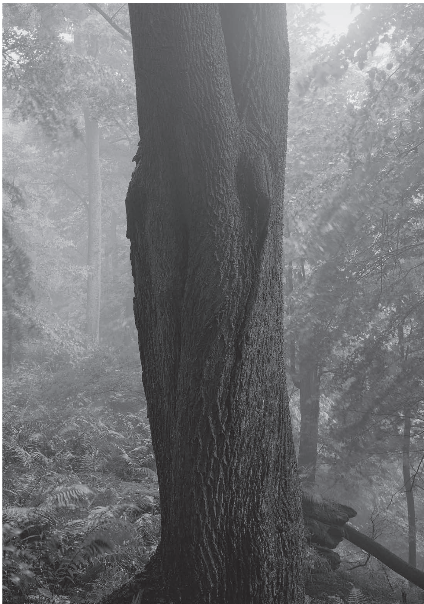
Javor v pralese