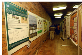
postery visely, kde se dalo