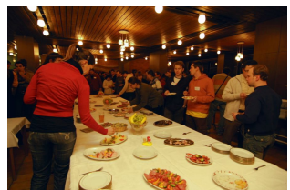
skvělou večerí připravily kuchařky jídelny Biologického centra AV ČR