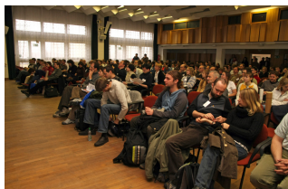
zaplněná aula Jihočeské univerzity