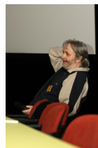
Jan Zrzavý odpovídá na dotazy posluchačů