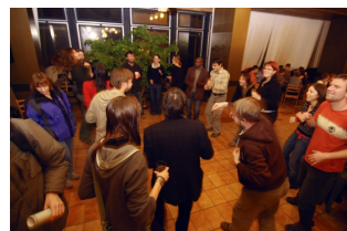
později večer došlo i na tanec