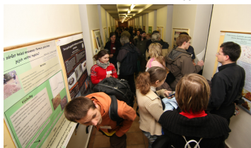
přeplněné chodby Biologického centra AV ČR při posterové sekci