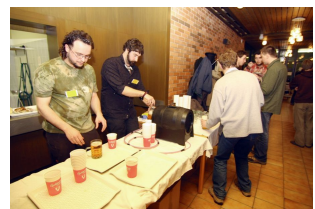
při společenském večeru se