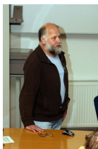
profesor Hynek Burda z univerzity Duisburg-Essen představil nový objev týkající se zvřecího vnímání magnetického pole