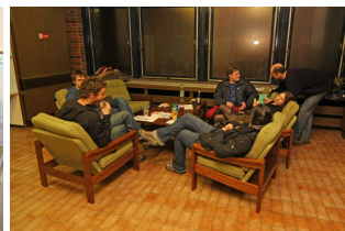
odpočinek po náročném dni