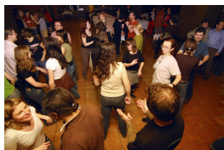
tančilo se do dvou v noci

čepovala dvanáctka od sponzora – českobudějovického Budvaru