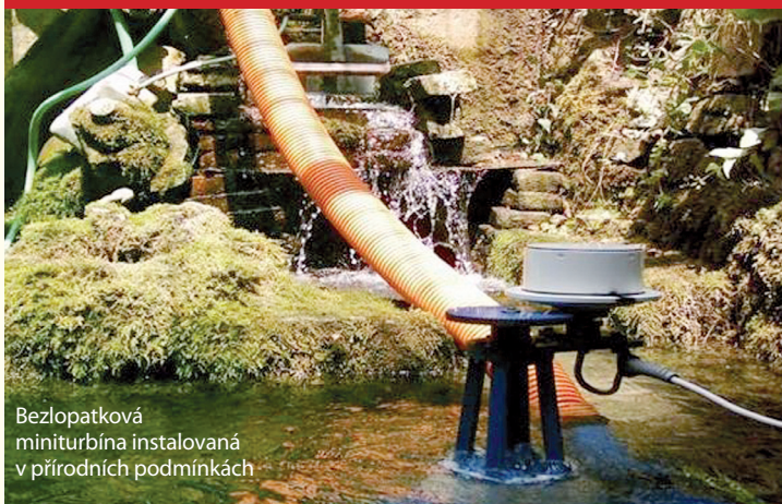
Bezlopatková miniturbína instalovaná v přírodních podmínkách