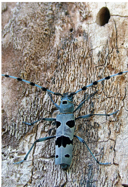
1 Označený samec tesaříka alpského ( Rosalia alpina ). V horní části fotografie je výletový otvor charakteristický pro tento druh.

Jeho vývojový cyklus trvá tři roky, přítomnost druhu mimo dobu výskytu dospělců (imag) prozradí oválné výletové otvory (7–10 × 4–5 mm) s ostrými okraji, orientované podélně s vlákny dřeva (obr. 1). Bývá popisován jako typický druh podhorských a horských pralesů vázaný na buk. Přesto tesařík alpský není výhradně horským broukem a není vázán zdaleka jen na buk. V horách se vyvíjí také v javoru klenu, jilmu horském a jasanu (Michalcewicz a Ciach 2012). Z jižní Evropy bývá uváděn i z mořského pobřeží, ve Francii žije u Atlantského oceánu na jasaněch ořezávaných podobně jako hlavaté vrby. Od jižního Maďarska na jih a východ obývá i lužní lesy a žije od nížin do hor, bez ohledu na přítomnost buku. Ve většině střední Evropy se donedávna choval předpisově a žil v bučinách středních a vyšších poloh. Pak se ale začal šířit luhy kolem velkých řek, kde se vyvíjí v jilměch ( Ulmus ), jasaněch (zřejmě v j. úzkolistém – Fraxinus angustifolia i j. ztepilém – F. excelsior ), javorech babyce, mléči a kleny ( Acer campestre , A. platanoides , A. pseudoplatanus ) i v invazním javoru jasanolistém ( A. negundo ), také v jírovci mađalu ( Aesculus hippocastanum ) a trnovníku akátu ( Robinia pseudacacia ; Hovorka 2011). Literární údaje zmiňují ještě některé další dřeviny.