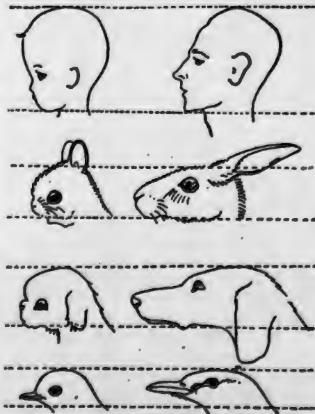
Obr. 1 Dětské schéma (podle K. Lorenze, 1943)

Jiným takovým fixním (vrozeným) podnětem je tzv. dětské schéma (viz obr. 1). Dospělí jedinci reagují na tento podnět – tj. mládě, dítě s velkou hlavou, klebnutou mozkovnou, velkýma očima, baculatými končetinami – tzv. ochranným chováním. Je to opět výsledek evoluční výhodnosti takového chování ve fylogenezi druhu. Péče a vstřícnost k mláďatům zvyšuje pravděpodobnost jejich přežití, zabraňuje také příp. agresivnímu jednání vůči nim. Argumentem pro vrozenou účinnost tohoto podnětového schématu je jeho transkulturní rozšíření, spolehlivě funguje i mezi vzdálenými etnickými skupinami (malý černošek vyvolá úsměvy a vstřícnost celého osazenstva i v pražském metru). Funguje dokonce i mezidruhově, vzpomeňte na ostražitou „úctu“, s jakou mjíjíte velkou dogu, a pozorujte chování dětí i dospělých při spatření jakýchkoli štěňat. Mechanismus je natolik pevný, že silnou emoční reakci rozhořčení vyvolá i pouhá zpráva o násilí páchaném na malých dětech. Takových podnětů je patrně více, např. mimická reakce matky na první úsměvy novorozence aj. Mnohé z toho využívá člověk i v oblasti umění (pantomima, balet) a komerce (tvary dětských hraček). Disneyův film Sněhurka a sedm trpaslíků je učebnicovým příkladem účinnosti tohoto podnětového schématu spolehlivě „zabírajícího“ v nejdílnějších kulturách.