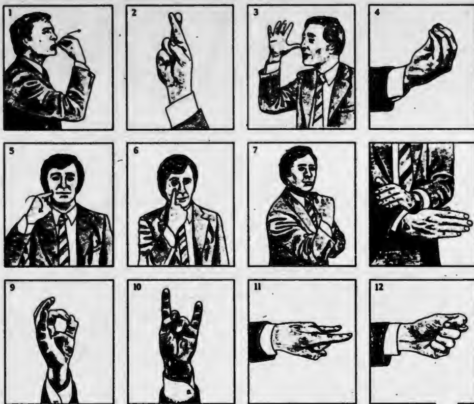
Obr. 2 Ukázka ze souboru gest z knihy D. Morrisse: Gestures, their origins and distributions (1979)

Pokusme se po širším úvodu charakterizovat jev, který známe pod označením neverbální komunikace. Je to přenos informací mezi jedinci bez použití artikulované řeči a pro první orientaci v této zajímavé problematice je dobré připomenout si několik vlastností tohoto jevu.