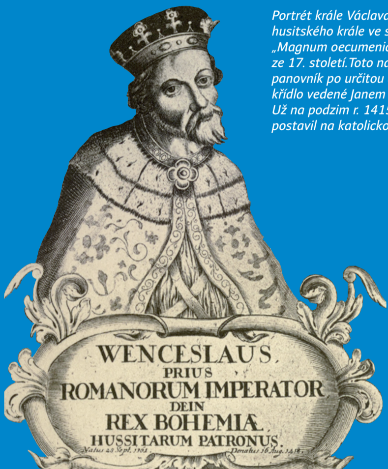
Portrét krále Václava IV. označeného jako husitského krále ve spise Hermanna von der Hardt „Magnum oecumenicum Constantiense concilium“ ze 17. století. Toto nařčení souviselo s tím, že panovník po určitou dobu podporoval reformní křídlo vedené Janem Husem na pražské univerzitě. Už na podzim r. 1415 se ale Václav IV. jednoznačně postavil na katolickou stranu.

Obraz, který středověká literatura zanechala, dal vzniknout pověsti špatného krále – krále tyрана a tu pak přebírala i literatura mladší.