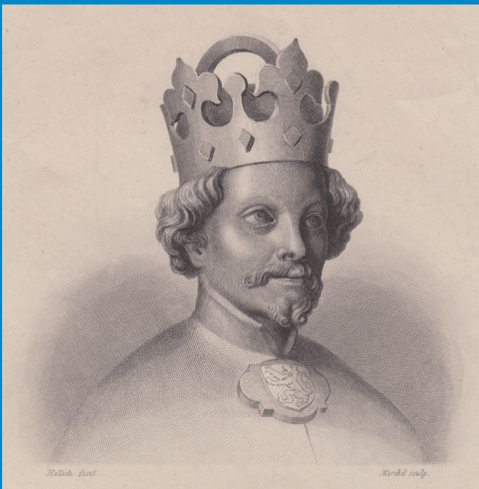
Rytina z 19. století s podobiznou Václava IV. podle sochy ze Staroměstské Mostecké věže v Praze.

Zcela jinou snahu lze sledovat v umění na přelomu 19. a 20. století. Spisovatelé tíhnoucí k realismu se ve svých historických románech snaží více přiblížit k zachycení historické skutečnosti. Takové jsou například práce Aloise Jiráska a Vratislava Václava Tomka. Přesto romantický ideál přežívá ještě na začátku 20. století v díle Františka Josefa Čečetky. Také v druhé polovině 20. století se v historické próze objevuje Václav IV. Z těchto moderních děl se opakovaného vydání dočkal román Miloše V. Kratochvíla Král obléká halenu z roku 1945. Autor se soustředí více než na popis významných historických mezníků Václavovy vlády především na pocity panovníka a důvodů, proč po svém sesazení z říšského trůnu stále častěji obléká halenu a utíká v přestrojení do krčmy mezi prosté lidi. S jeho náhlým skolem roku 1419 autor připodobňuje odchod starého světa, ale zároveň zrod plamenů nové doby.