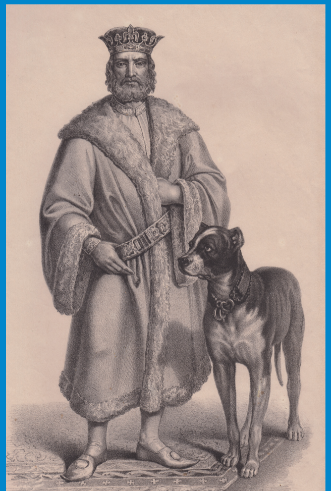
Romantická imaginace panovníka Václava IV. v doprovodu věrného loveckého psa, stejný motiv využil také V. K. Klicpera v povídce Točník .