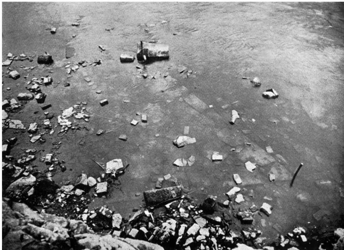
Pilř Juditina mostu pod vodou při malostranském břehu v roce 1940 (podle Čarek 1947, obr. 44)