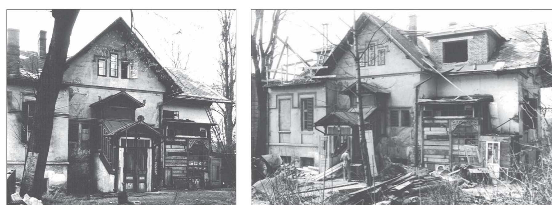
Stav objektu před zásadní rekonstrukcí v 60. letech 20 století