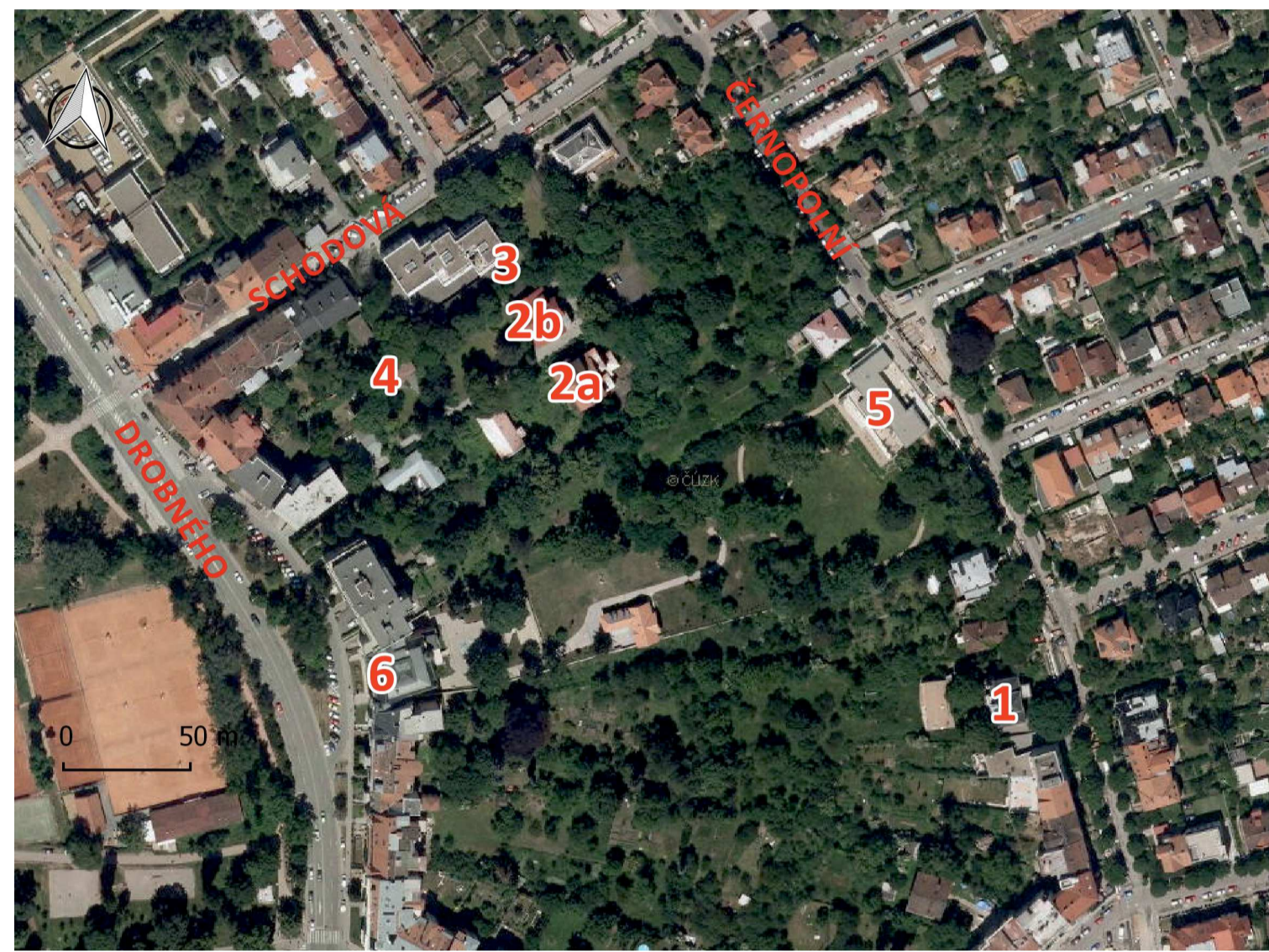
Současný letecký snímek (2018)