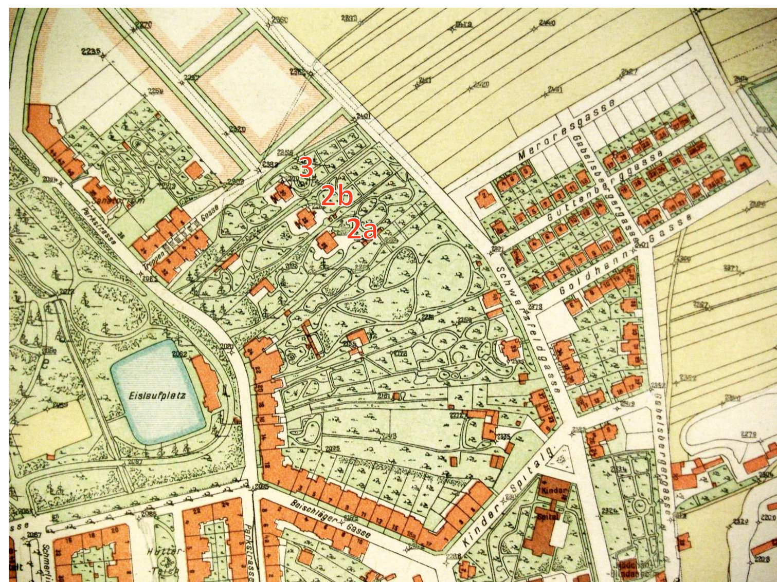
Situační plán zemského hlavního města Brna z roku 1909