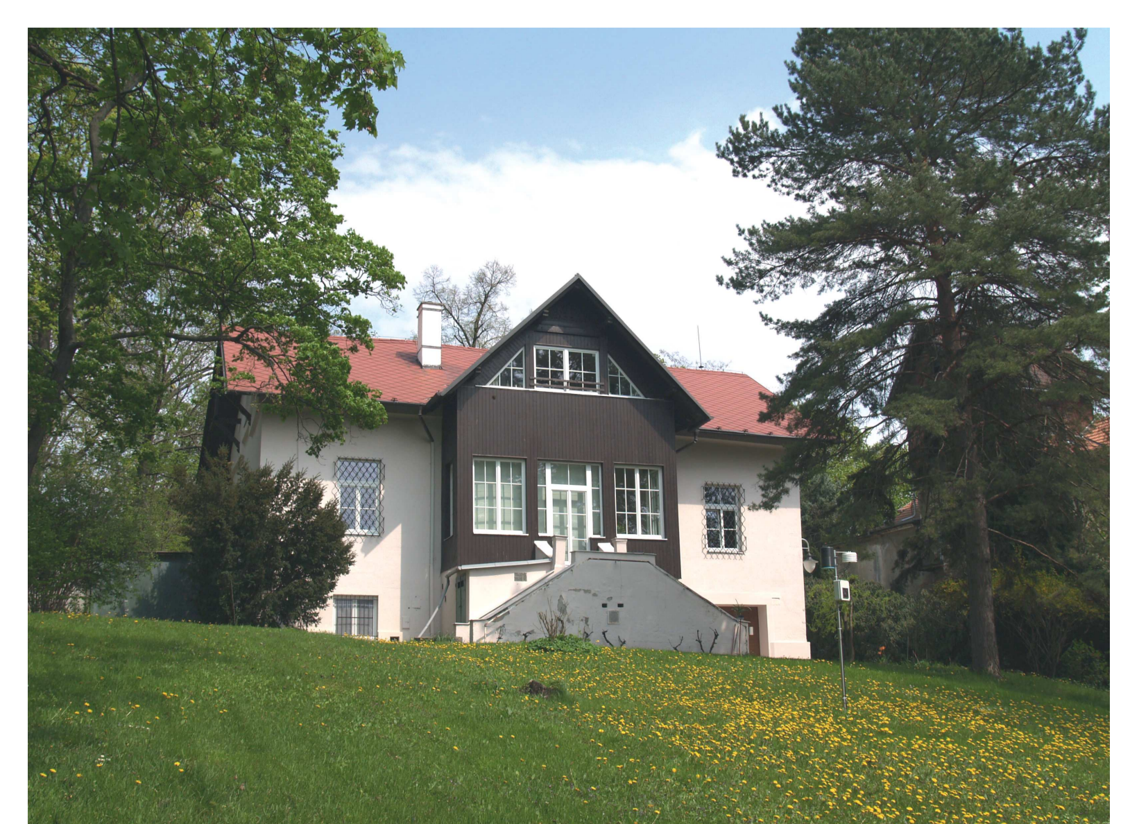
Stav roku 2010 po generální rekonstrukci (2008)