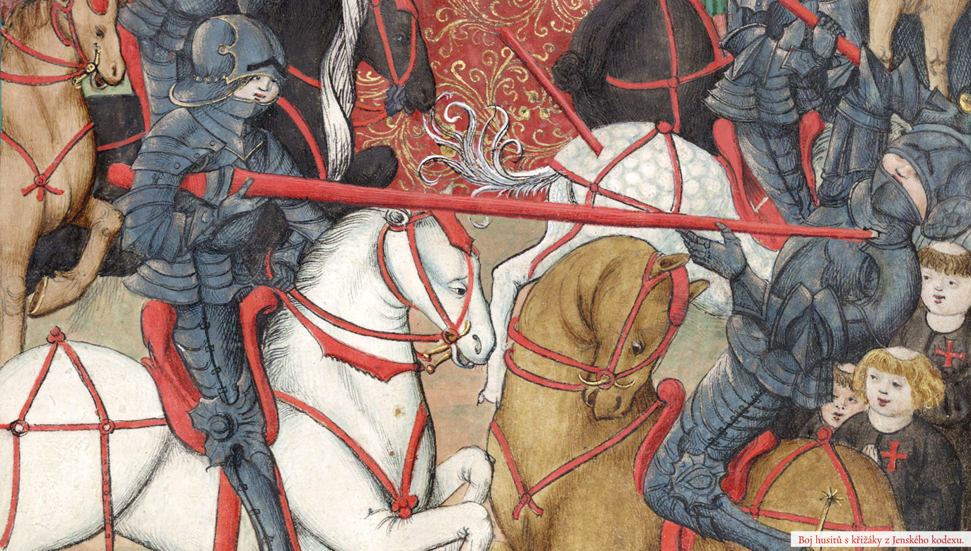
Boj husitů s křižáky z Jenského kodexu.