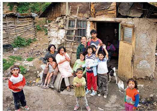
■ ... a také k Romům. V obou případech se negativní hodnocení pohybuje nad 70 %.

žili překonat sjednocováním kontinentu, na straně druhé docházelo k hrůzostrašným masakrům během jugoslávské války.