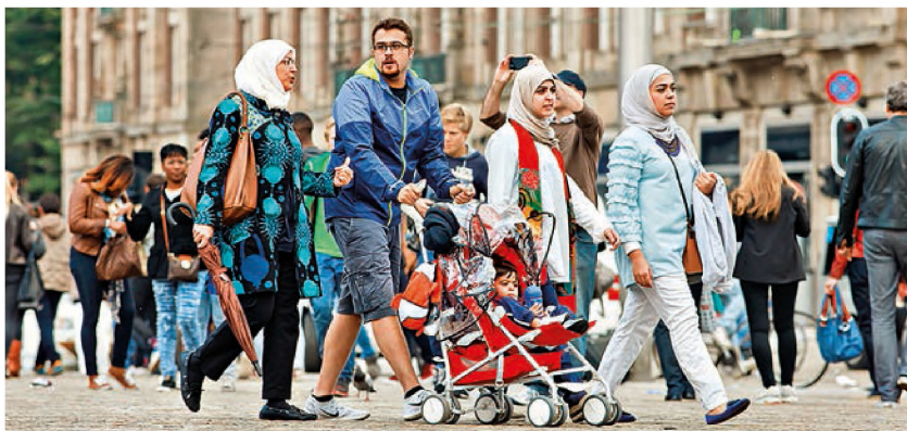
■ Podle průzkumů mají Češi nejvíce negativní vztah k Arabům...