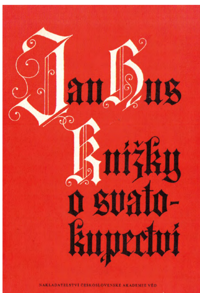
Novodobé vydání Knížek o svatokupectví z roku 1954.

„Svět pak, ten mě všudy obklíčil a oblehl na všechny strany, a pěti branami mě raní. Pět bran jest pět smyslů v člověku, kterýž je má: zrak, sluch, okušení, povonění a dotknutí. Aj, těmi branami mě raní svět, a smrt vcbází okny mými v duši mou; neb hledí oko, a smysl myslí převrátí; slyší ucho, a úmysl srdečný zkriví; vonění dobrému myšlení překáží; ústa mluví, a lží jiné hanějí, žerty i jiné škodlivé a marné řeči vydávají; a dotýkáni k smilství popouzí, a nebudeli brzy odvrženo, ihned páli tělo a pudí mysl, aby přijala libost, a vůle aby k libosti přistoupila, a tak aby se hřích dokonal.“ (Dcerka, 5. kapitola)