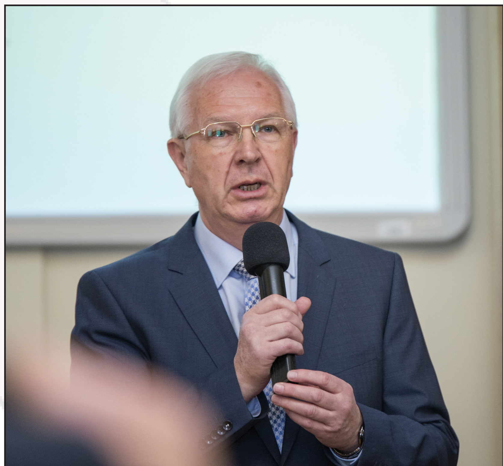
Předseda Akademie věd České republiky prof. Ing. Jiří Drahoš, DrSc. na pracovním setkání k programu Regionální spolupráce v Praze v roce 2016

Setkání představitelů AV ČR se zástupci krajů a partnery k programu Regionální spolupráce AV ČR s kraji ČR se v roce 2017 koná pod záštitou hejtmána Jihomoravského kraje.