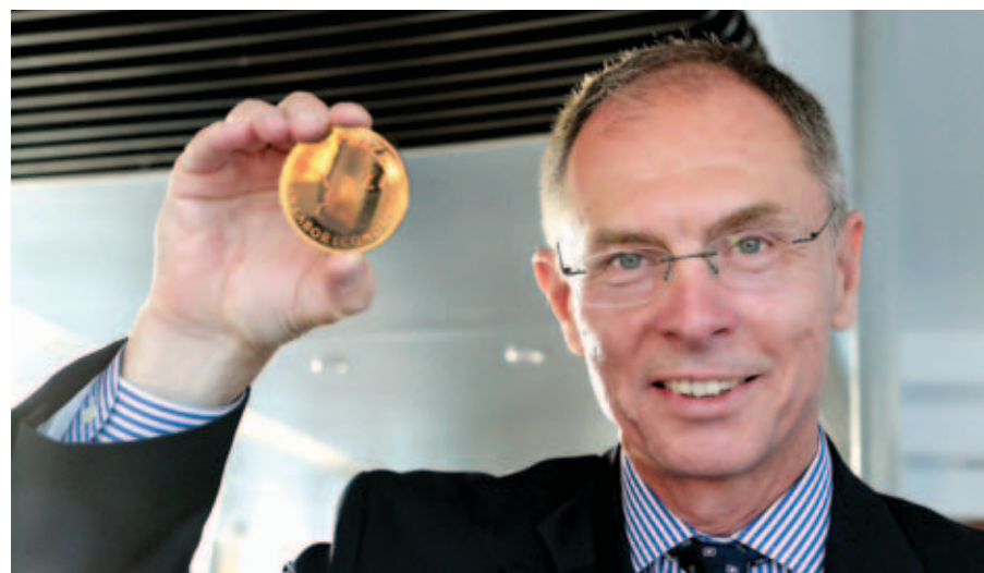
2015, udělení ceny IZA, Bonn Německo

Na druhé straně si musíme položit také perspektivní otázku, jak a kdy