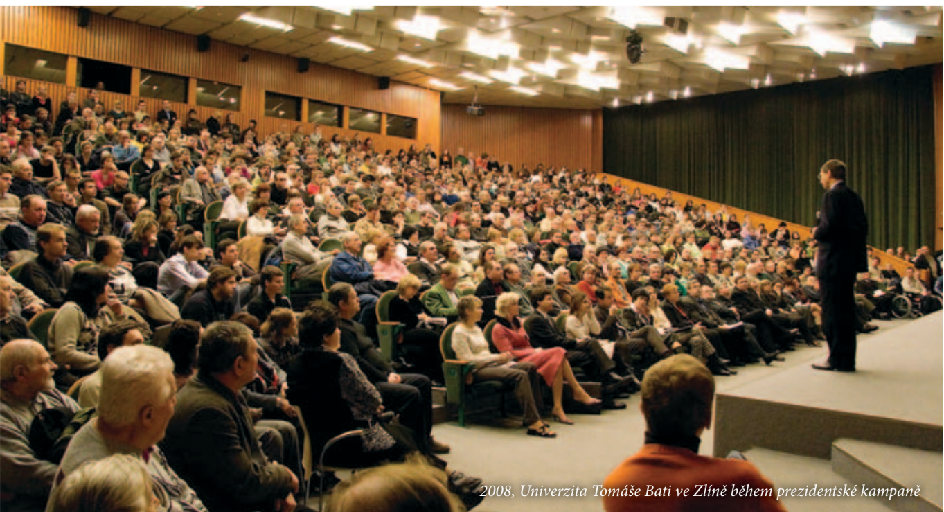
2008, Univerzita Tomáše Bati ve Zlíně během prezidentské kampaně