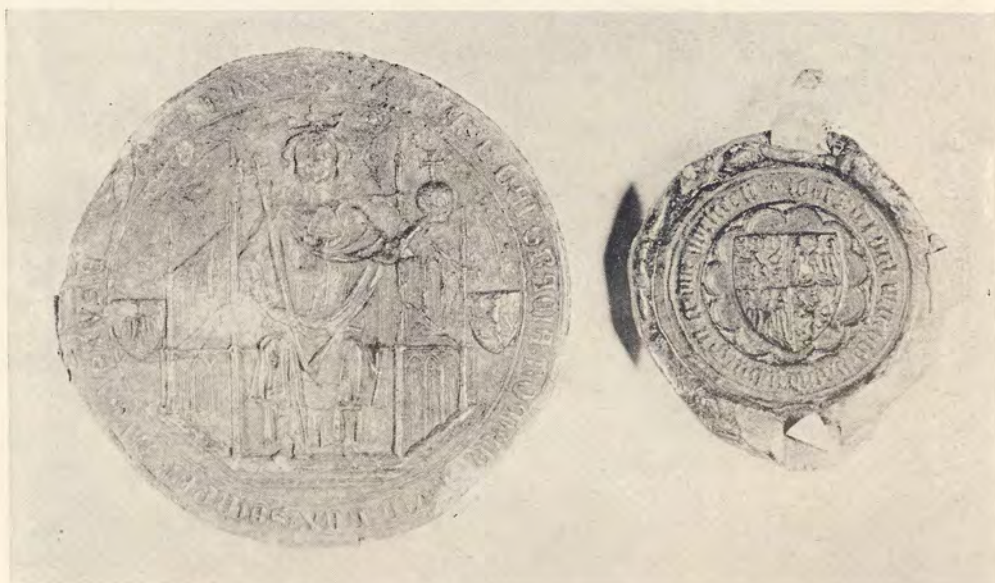
71. Listina krále Václava IV. z roku 1395