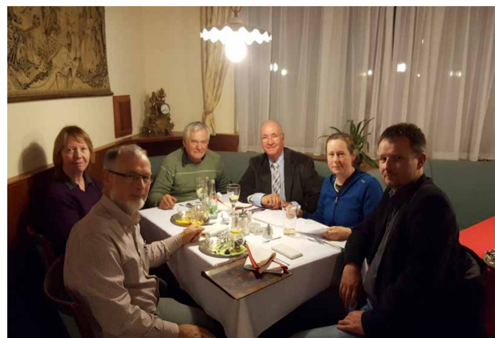
Příprava projektu EUS