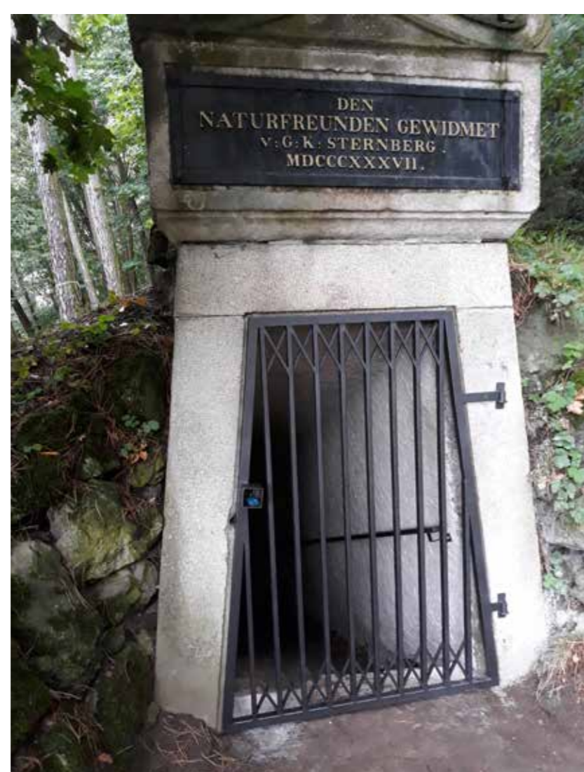
Rekonstruovaný portál a štolá Komorní Hůrka, 2016-2017