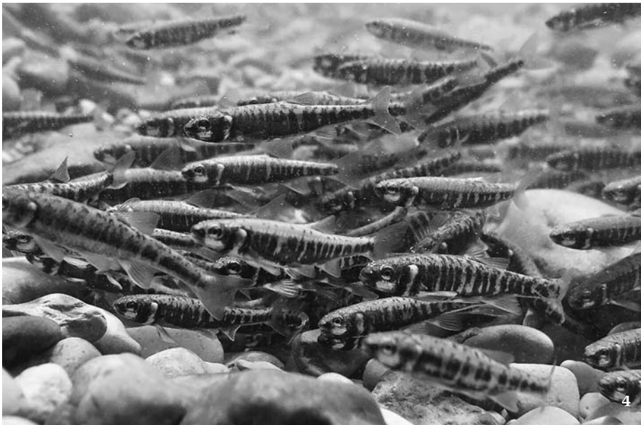
4 Hejno střevele potoční ( Phoxinus phoxinus ) v období tření. Zástupce máloostných (Cypriniformes), pravděpodobně nejpočetnějšího řádu ryb (a obratlovců vůbec).

Velký problém tradičně přetrvává u hlubokomořských pilonošů (Beryciformes) a mořatek (Stephanoberyciformes, někdy ještě z nich vyčleňovaných Cetomimiformes) a k nim na základě morfologie řazených pruhatců (Holocentriformes) z mělkého moře. Ani celogenomová studie zahrnující 13 druhů z těchto skupin uspokojivě nevysvětlila jejich fylogenetickou pozici. Určitě existují dvě jasné odlišné skupiny, které částečně odpovídají původním řádům pilonošů a mořatek, nicméně nominotypický rod pilonoš ( Beryx ) spadá do druhé skupiny k mořatkám. Lze tedy očekávat, že v souladu s pravidly nomenklatury bude muset dojít ke změnám názvů těchto linií. Pruhatici (Holocentriformes) jsou určitě rovněž samostatným řádem. Původně byli, částečně i na základě morfologické podpory (Willey a Johnson 2010), považováni za sesterskou linii celé skupině Percomorpha, nyní se spíše zdají být sesterskými právě mořatkám. Tyto tři skupiny (zřejmě budoucí řády) pravděpodobně tvoří monofyletickou skupinu. Z jejich charakteristických znaků (synapomorfii) je zajímavé zmínit tzv. Jakubowského orgán, což jsou přidatné útvary smyslových buněk – neuromastů na hlavě. Dříve se myslelo, že jde o synapomorfii pilonošů, ale podle současné fylogeneze muselo jít o znak přítomný u hlubokomořského předka všech tří linií, tj. pilonošů, mořatek a pruhatců, jenž u některých druhů druhotně vymizel.