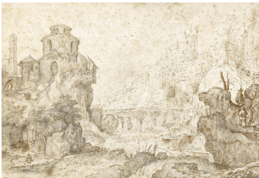
Obr. 17: Fantaskní krajina s horskou říčkou s Jelením příkopem a katedrálou sv. Víta, Roelandt Savery, kresba hnědým inkoustem, Kortrijk 1575–1639, Utrecht, rozměry 173 x 244 mm, Sotheby's EST. 1744 [online] .

Fig. 17: Surreal landscape, mountainous river landscape with Stag Moat and the Cathedral of the St Vitus, Roelandt Savery, pen and brown ink, Kortrijk 1575–1639, Utrecht, size 173 by 244 mm, Sotheby's EST. 1744 [online] .