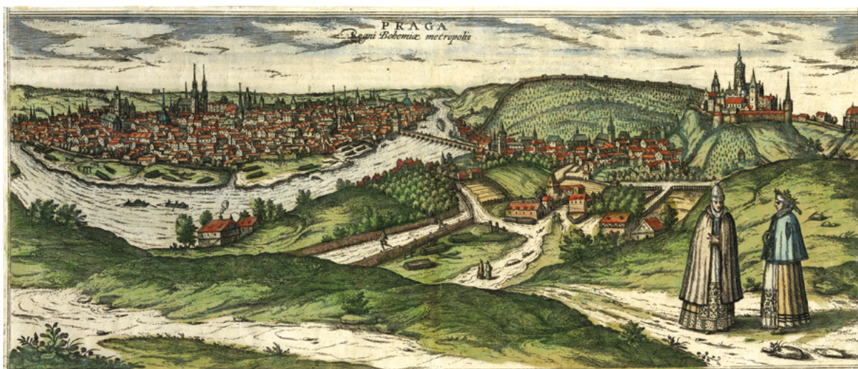
Obr. 16: Praha, Pražský hrad, Joris Hoefnagel, Abraham Hogenberg, kolorovaná mědirytina z knihy Civitas Orbis Terrarum , 1598, rozměry 390 x 523 mm. Muzeum hlavního města Prahy, inv. č. 9993.