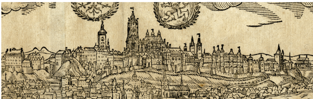
Obr. 19: Pražský hrad, Jan Willenberg, dřevorez, 1601, výřez. Muzeum hlavního města Prahy, inv. č. 27739 IIIA7.