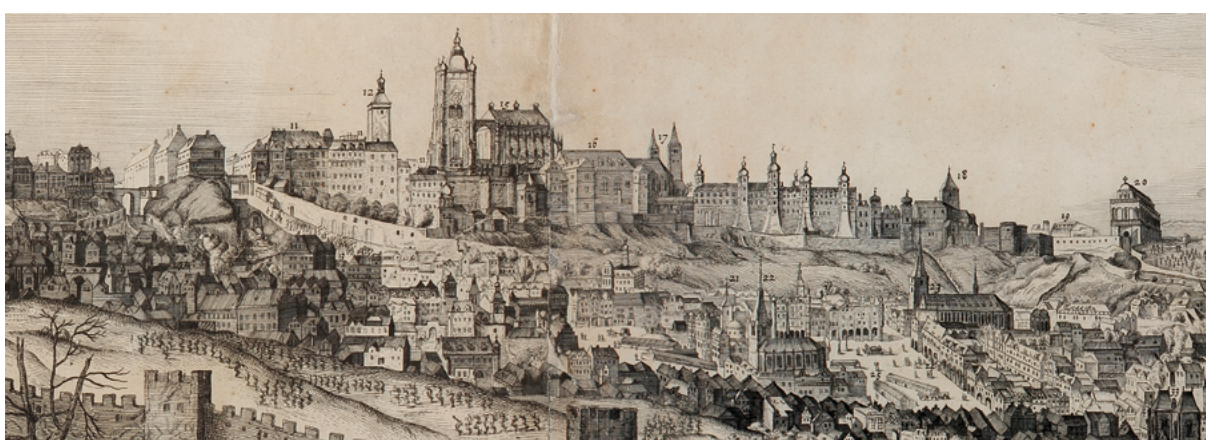
Obr. 20: Praha, tzv. Sadelerův prospekt, Filip van der Bossche (1606), mědirytina, vydal Jiljí Sadeler 1618, výřez. Muzeum hlavního města Prahy, inv. č. 17442.