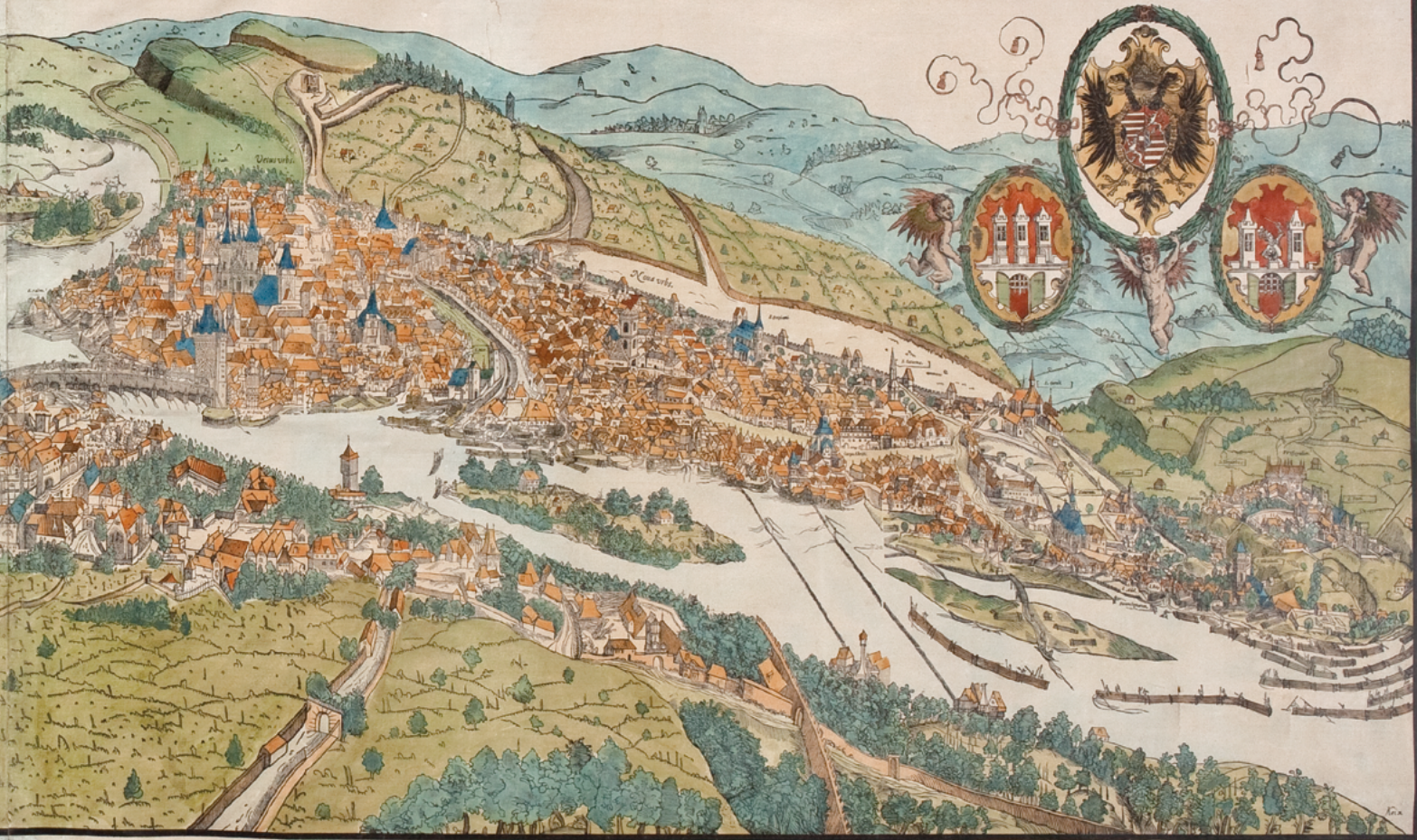
Obr. 13: Tzv. Vratislavský prospekt, dřevorez, 1562, fotolitografická reprodukce z roku 1904, rozměry 557 x 1 965 mm. Muzeum hlavního města Prahy, inv. č. HP 2003_0042.