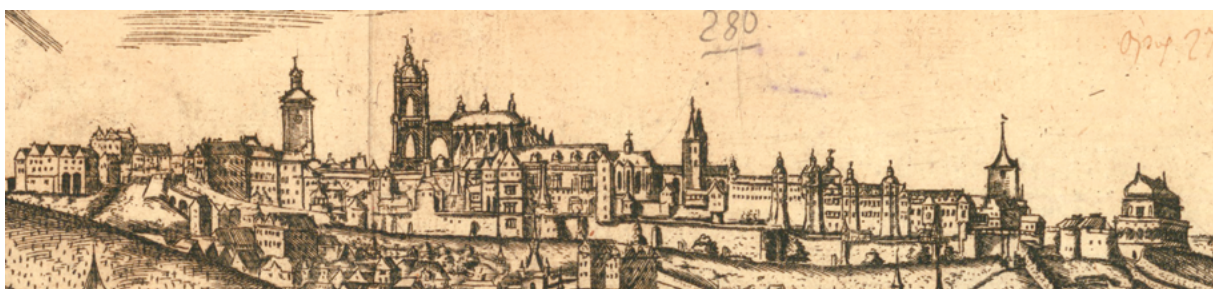
Obr. 15: Panorama Prahy – Letákový list, anonym, Prátelé Pánu Bohu milí , 1582, výřez. Strahovská knihovna, sign. DR I 21c, Dobřenského kodex, 3. svazek, fol. 317.