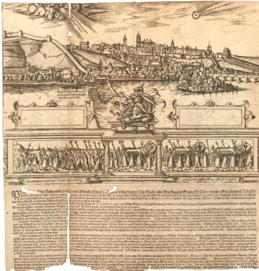
Obr. 14: Panorama Prahy – Letákový list, anonym, Prátelé Pánu Bohu milí , 1582. Strahovská knihovna, sign. DR I 21c, Dobřenského kodex, 3. svazek, fol. 317.