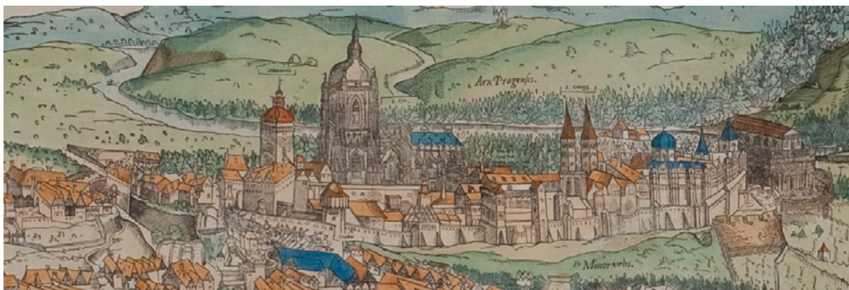
Obr. 12: Tzv. Vratislavský prospekt, dřevorez, 1562, fotolitografická reprodukce z roku 1904, výřez. Muzeum hlavního města Prahy, inv. č. HP 2003_0042.