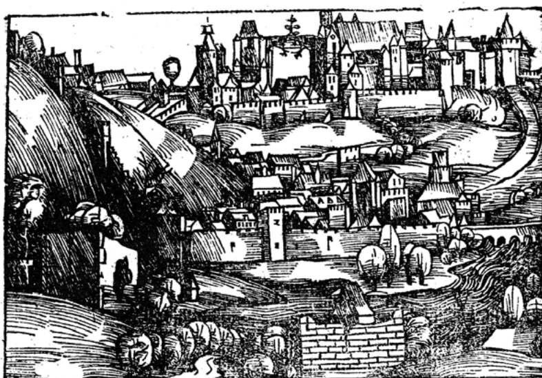
Obr. 11: Titulní strana tisku Neue zeytung ... M.D.XXXXI , výřez (podle Večeřová 1996, obr. 2 ).