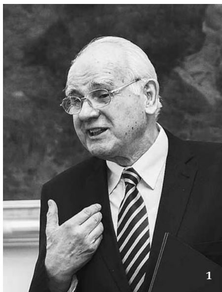
1 Bohuslav Ošťádal při udílení medaili Akademie věd ČR vědeckým osobnostem.

Bohuslav Ošťádal (*1940) vystudoval Fakultu dětského lékařství Univerzity Karlovy v Praze, kde se již během studia začal věnovat vědeckému výzkumu. Od r. 1966 pracuje ve Fyziologickém ústavu Akademie věd, prakticky od začátku ve funkci vedoucího Oddělení vývojové kardiologie, v letech 1990–95 jako ředitel ústavu. Ve své vědecké práci se zabývá především otázkami ontogenetického vývoje srdce a koronární cirkulace z hlediska funkčních změn, citlivosti k léčivům, odolnosti k ischemickému poškození či pozdních důsledků působení rizikových faktorů v časných fázích vývoje, zejména s ohledem na pohlavní rozdíly. Jeho čtené práce patří v této oblasti k prioritním, dosáhly značného mezinárodního uznání a jsou bohatě citovány.