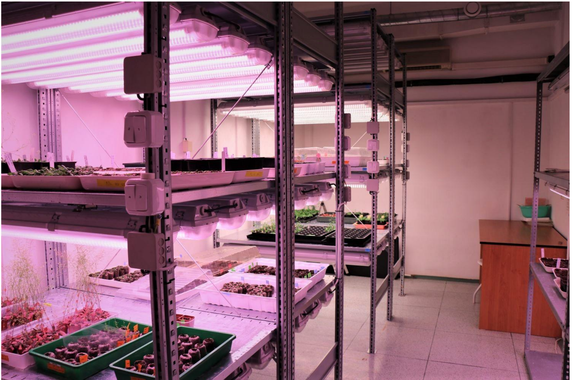
Kromě růstových komor se rostliny v Jiffy tabletách pěstují také v kultivačních místnostech.