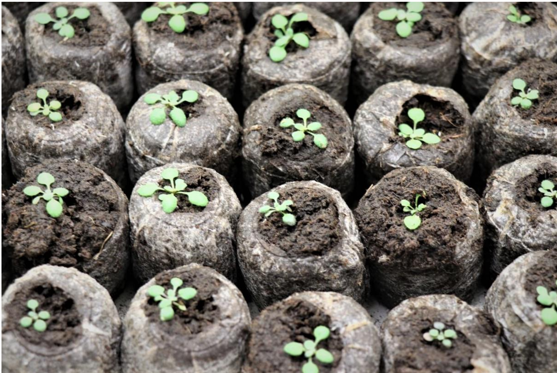
Asi dvoutýdenní rostliny huseníčku rolního ( Arabidopsis thaliana ) v rašelinových Jiffy tabletách.