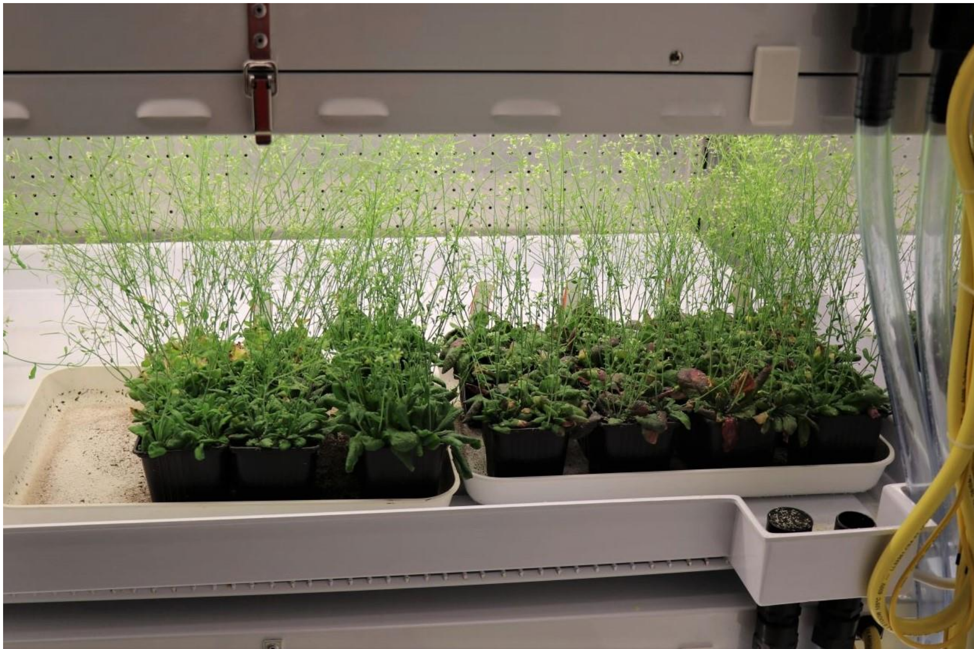
Na snímku jsou zachycené kvetoucí rostliny huseníčku rolního ( Arabidopsis thaliana ), umístěné v růstové komoře.