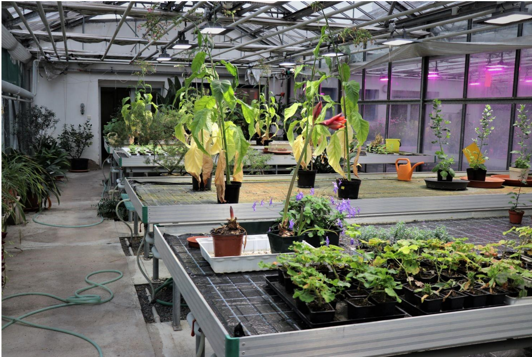
Na snímku je zachycen vnitřní prostor skleníku. Na druhém stole nalevo a uprostřed můžete vidět tabák virginský, jednu z používaných pokusných rostlin.