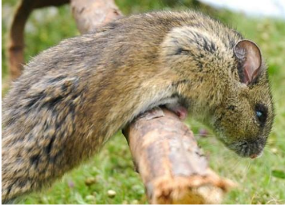
Stenocephalemys zimai