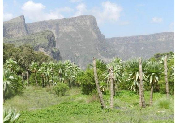
Afroalpínské louky v polohách nad 3 500 m n. m. Zde v Simienských horách, nejvyšším pohoří Etiopie, žije Stenocephalemys zimai.