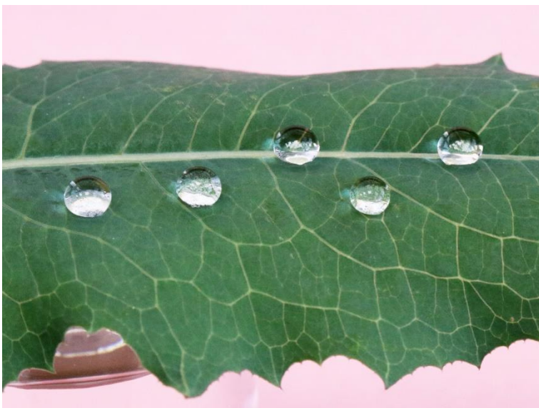
Kapky vody na supersmáčivém listu lociky kompasové.