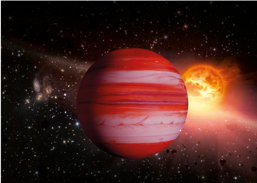
Rudá planeta jupiterového typu s hvězdou