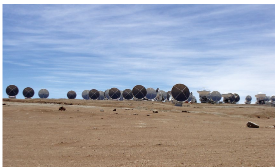
Celkový pohled na uskupení antén ALMA na AOS (5 000 m n. m.).

MB: Vědecký výzkum Slunce observatoří ALMA byl plánován od samého jejího počátku. Nicméně nešlo to „samo“. Bylo především nutné vytvořit procedury, které překonají náročné problémy, jež pozorování Slunce představuje. Práci na tomto úkolu se zúčastnili vědci z USA, Japonska a Evropy. Náš uzel byl ESO pověřen, abychom evropskou účast vedli. Jedním z našich úkolů poté bylo, jak to zařídit, aby bylo možné pozorovat s tímto citlivým přístrojem i velmi jasné Slunce a přitom nemít obrázek „přeexponovaný“. Také jsme museli vyřešit problém vlastního pohybu Slunce a objektů na něm mezi hvězdami. Naše procedury jsme nakonec testovali přímo v Chile, konkrétně metodu zeslabení signálu, která zabraňuje přeexponování. Model jsme odzkoušeli na pozorování Měsíce a výsledky nás velmi uspokojily. V roce 2016 ALMA schválila uvedení slunečních pozorování do provozu a od roku 2017 již probíhají konkrétní výzkumy a ty nesou své první výsledky. K překvapivým zjištěním získaným díky těmto raným vědeckým pozorováním Slunce s observatoří ALMA jistě patří poněkud nečekaná emise na vlnové délce 3 mm v atmosféře přímo nad centrem jinak tmavých slunečních skvrn nebo neočekávaný obraz tzv. filamentů, tmavých vláken pozorovaných