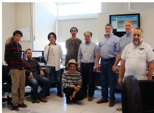
Společný snímek účastníků Solar ALMA Observing Campaign 2014 v řídicím středisku operací ALMA OSF (cca 3 000 m n. m.).

Mám na mysli právě naši účast v projektu observatoře ALMA, to, že v ČR funguje jeden ze sedmi uzlů Evropského ALMA centra (EU ARC) a od roku 2015 se statusem velké výzkumné infrastruktury ČR. Především naše v evropském kontextu unikátní expertiza pro sluneční výzkum s ALMA dělá z našeho uzlu – byť v úzkém a specifickém segmentu výzkumu – skutečně světově špičkové pracoviště.