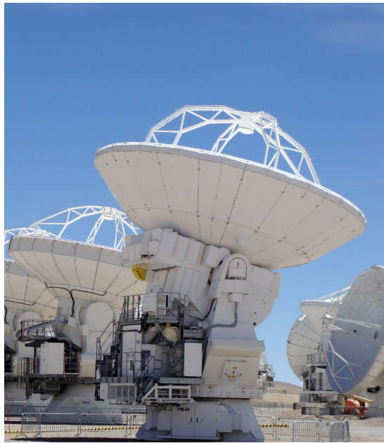
Antény hlavního pole o průměru 12 m pozorující Slunce.

v červené čáře atomárního vodíku H \alpha : ALMA má potenciál změnit naše dosavadní představy o sluneční atmosféře, proto s napětím očekáváme další zajímavé objevy v oblasti sluneční fyziky.